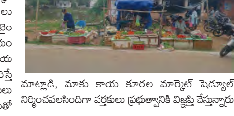
మాట్లాడి, మాకు కాయ కూరల మార్కెట్ పెద్దలతో నిర్మించవలసిందిగా వర్తకులు ప్రభుత్వానికి విజ్ఞప్తి చేస్తున్నారు

మొగలూరు మే 30 (ప్రభాతవార్త) ముత్తాలపల్లి పంచాయతీ పరిధి వార తిప్పర్లలో ఉన్న చేపల మార్కెట్ వద్ద రహదారి ప్రక్కనే కాయ కూరలు మరకాణములు, ఉంచి, కాయ కూరలు తయారుచేస్తున్నారు. ఉదయం మంచియ సాయంత్రం, మార్కెట్ లైం లో, దుకాణములు రోడ్డు ప్రక్క ఉంచడం వలన, ప్రాప్యత అంతరాయం కలిగి, ప్రమాదాలు జరుగుతున్నాయని, శుక్రవారంనాయంత్రం, కాయ కూరలవర్తకులు మాట్లాడుతూ మాకు పెద్ద లోకాపందంతో, వర్షం కురిస్తే దుకాణములు మార్చుకుంటుంటే, పెద్ద లోకాపందంతో అనేక ఇబ్బందులు పడుతున్నామని, దీనిని వెంటనే ప్రభుత్వం స్పందించి, ఉన్నతాధికారులతో