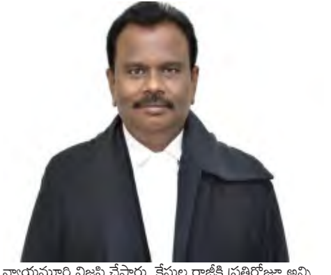
న్యాయమూర్తి విజ్ఞప్తి చేసారు. కేసుల రాజీ ప్రతిరోజూ అన్ని కోర్టుల్లో డి లోక్ అదాలత్ సిట్టింగ్ నిర్వహిస్తున్నామని, ఆ సిట్టింగ్ ల ద్వారా ఇరు పార్టీల మధ్య రాజీకి ప్రయత్నం చేస్తామన్నారు. న్యాయవాదులు, పోలీసు అధికారులు కక్షిదారులకు జాతీయ లోక్ అదాలత్ గురించి విస్తృతంగా అవగాహన కల్పించి ఎక్కువ కేసుల రాజీ కృషి చేయవలసిందిగా కోరారు.

భీమవరం మే 30 ప్రభాతవార్త : రాష్ట్ర మరియు జిల్లా న్యాయ సేవాధికార సంస్థల ఆదేశాల మేరకు రాష్ట్ర వ్యాప్తంగా నిర్వహిస్తున్న జాతీయ లోక్ అదాలత్ లో భాగంగా మండల న్యాయ సేవా సంస్థ ఆధ్వర్యంలో భీమవరం లో వున్న అన్ని కోర్టుల ప్రాంగణంలో జూలై నెల 5వ తేదీన జాతీయ లోక్ అదాలత్ నిర్వహిస్తున్నామని భీమవరం 3వ అదనపు జిల్లా జడ్జి, సంస్థ చైర్మన్ గా పూర్తి అదనపు బాధ్యతలు నిర్వహిస్తున్న కోర్టు కోర్టు ప్రత్యేక న్యాయమూర్తి గౌరవ డా. బి.లక్ష్మి నారాయణ అన్నారు. జాతీయ లోక్ అదాలత్ లో పెండింగ్ లో ఉన్న అన్ని సివిల్ కేసులు, రాజీ కాదర్ గ్రీమినల్ కేసులు, మోటార్ యాక్సిడెంట్ ఇన్సూరెన్స్ కేసులు, చెక్కు బాకీ కేసులు, మనోచర్ల కేసులు, గృహహింస కేసులు, బ్యాంకుబి ఎస్ ఎస్ ఎస్ మొండి బాకీ కేసులు తదితర కేసులు రాజీ చేసుకోవచ్చున్నారు. సివిల్ కేసు రాజీ పడితే అప్పటికే కట్టిన కోర్టు ఫీజు వాపసు వస్తుందన్నారు. జాతీయ లోక్ అదాలత్ లో రాజీ చేసుకుంటే అది అంతిమ తీర్పు కాబట్టి అప్పీలు చేసుకునే అవకాశం ఉండదన్నారు. కక్షిదారులు ఈ సదవకాశాన్ని వినియోగించుకుని రాజీయే జాతీయ లోక్ అదాలత్ లో కేసులను రాజీ చేసుకోవడం ద్వారా కాలాన్ని, వ్యయాన్ని ఆదా చేసుకోవలసిందిగా