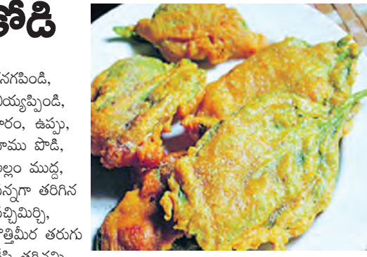
శనగపిండి, బియ్యపిండి, కారం, ఉప్పు, వాము పొడి, అల్లం ముద్ద, సన్నగా తరిగిన పచ్చిమిర్చి, కొత్తిమీర తరుగు వేసి తగినన్ని నీళ్లతో చిక్కగా కలియతిస్తావని. బాణలిలో నూనె కాగిన తర్వాత బచ్చలికాయలను పిండిలో ముంచి తీసి వేయించుకోవాలి. □