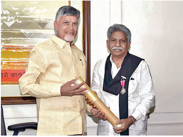
ముఖ్యమంత్రి చంద్రబాబు నాయుడుని ఢిల్లీ కలిసిన పద్మశ్రీ మండ కృష్ణ మాదిగ