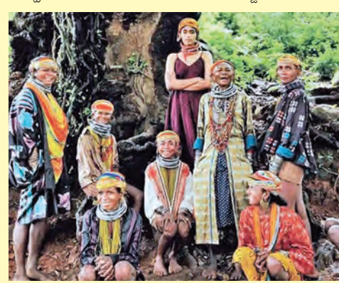
అల్పమయ్యేది కాదు. అలాగని వెనక్కి తిరిగి వెళ్లాలని కోలేదు. తరచూ ఆ గిజనులతో మాట్లాడుతూ ఉండటం వల్ల క్రమంగా అనుబంధం పెరిగింది. నేనూ వారి

చెప్పినప్పుడు వాళ్లంతా శ్రద్ధగా వినేవారు కానీ పెద్దగా స్పందించేవారు కాదు. మొదట ఈ పరిస్థితి నాకు